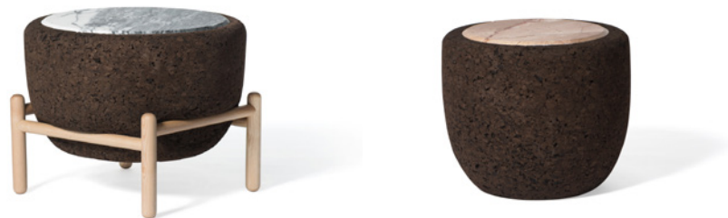
Table basse Flora

Description: FLORA est un ensemble de tables basses qui évoquent les plantes que nous offrons à ceux que nous aimons, il y a donc une ressemblance entre prendre soin des plantes et prendre soin des objets. Ces tables combinent des matériaux naturels, possèdent quatre tailles et six combinaisons des différentes couleurs et peuvent être utilisées séparément ou ensemble.